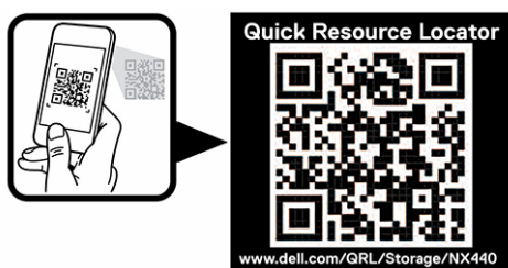
Ilustración 3. Código QR para NX440