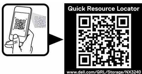
Ilustración 2. Código QR para NX3240