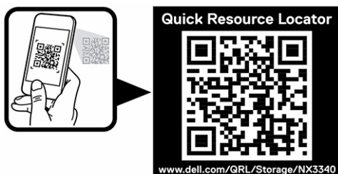
Ilustración 1. Código QR para NX3340