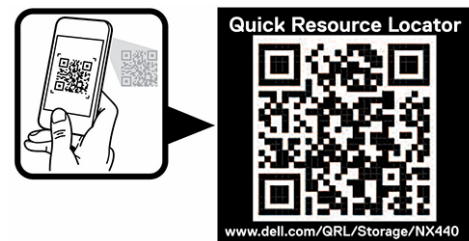
Abbildung 3. QR-Code für NX440