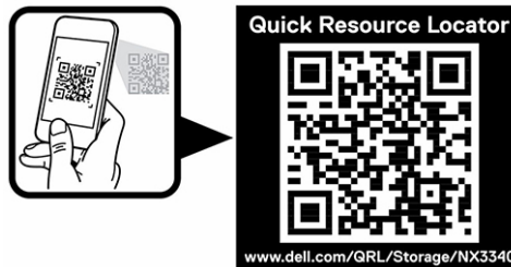
Abbildung 1. QR-Code für NX3340