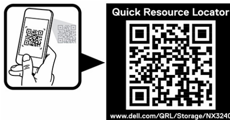
Abbildung 2. QR-Code für NX3240