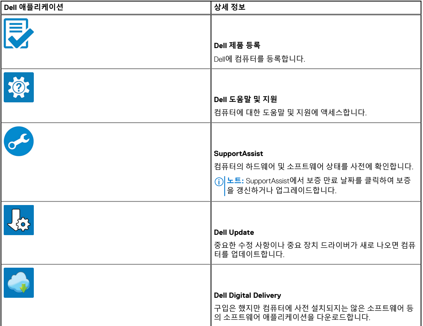
표 1. Dell 앱을 찾습니다

3. Windows 시작 메뉴에서 Dell 앱을 찾고 사용합니다(권장).