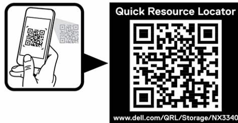
Abbildung 1. QR-Code für NX3340