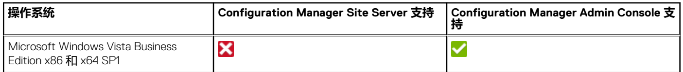
表. 1: 安装 Dell EMC Server Deployment Pack 的受支持操作系统列表 (续)