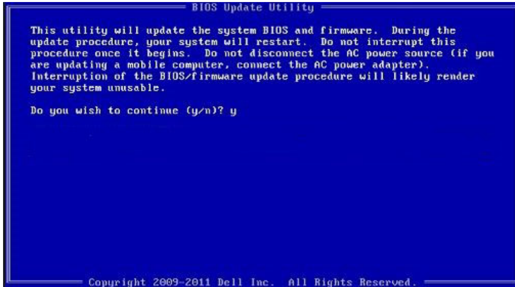
شكل 1. شاشة تحديث نظام الإدخال/الإخراج الأساسي (BIOS) عبر نظام تشغيل الأقراص (DOS)