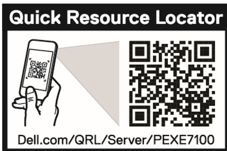
图 3: 适用于 PowerEdge XE7100、XE7420 和 XE7440 系统的快速资源定位符