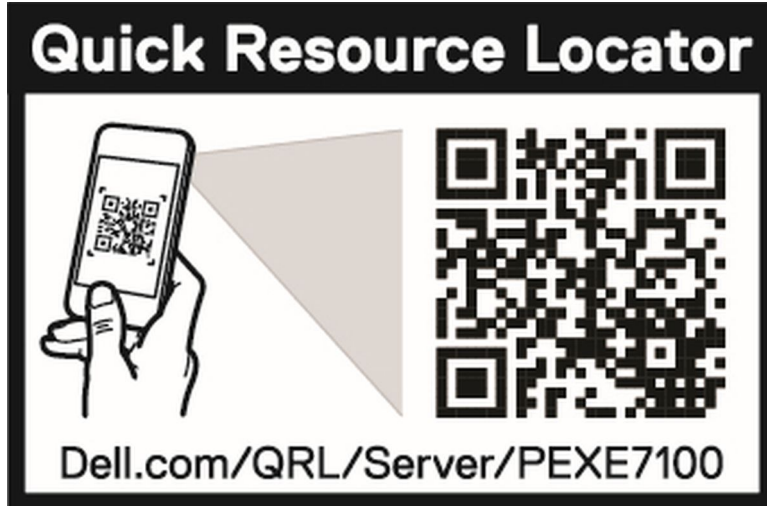
그림 3 . PowerEdge XE7100, XE7420 및 XE7440 시스템용 QRL(Quick Resource Locator)