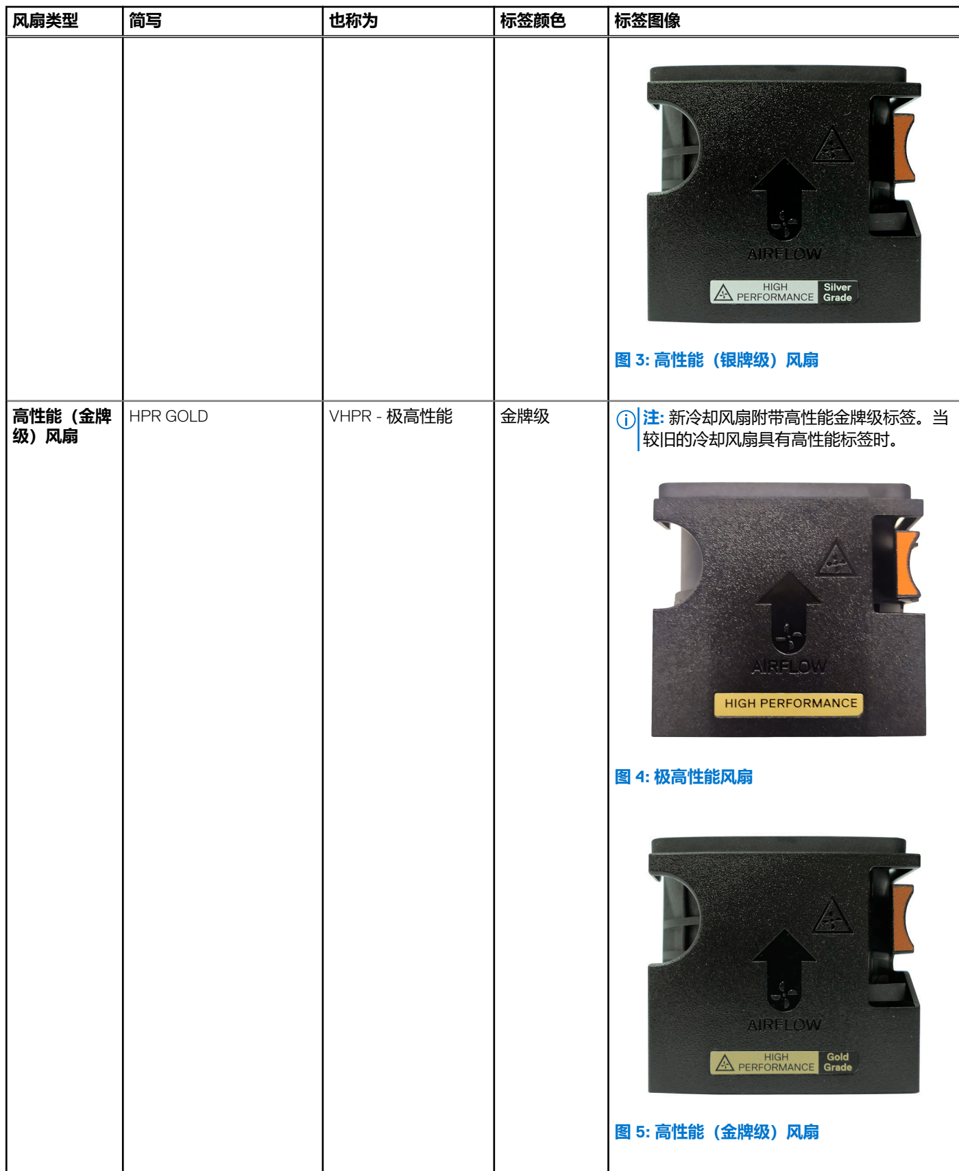
表. 5: 冷却风扇规格 (续)