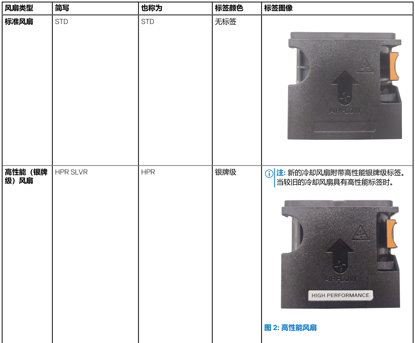
图 2: 高性能风扇