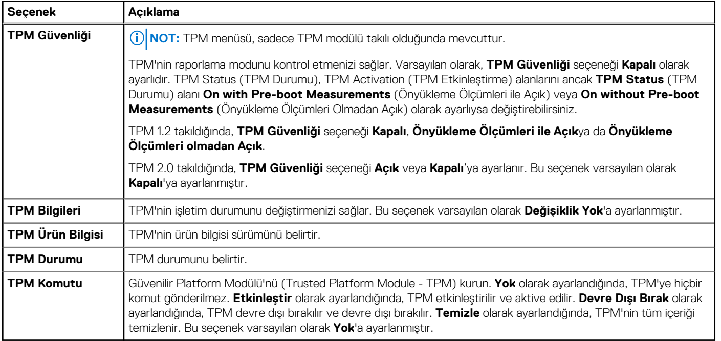
Tablo 22. TPM 2.0 güvenlik bilgileri