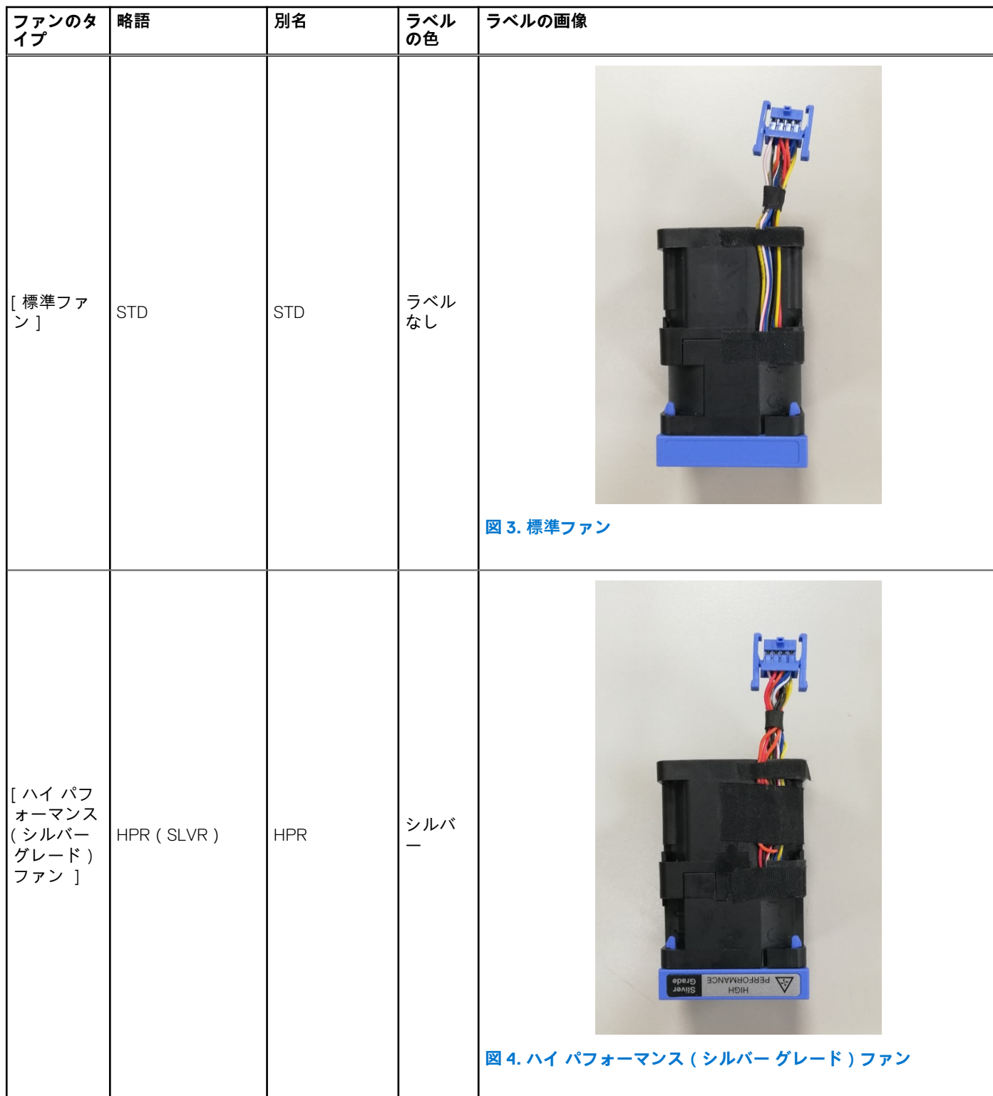
表 5. 冷却ファンの仕様 ( 続き )