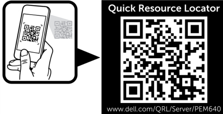
그림 2 . PowerEdge M640 시스템용 QRL(Quick Resource Locator)