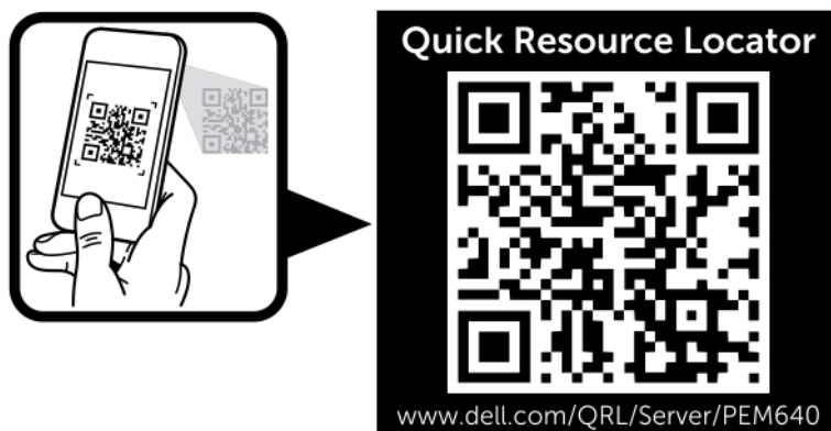
Ilustración 2. Localizador de recursos rápido para el sistema PowerEdge M640