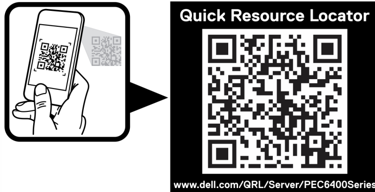
图 2: PowerEdge C6400 和 C6420 系统的快速资源定位符