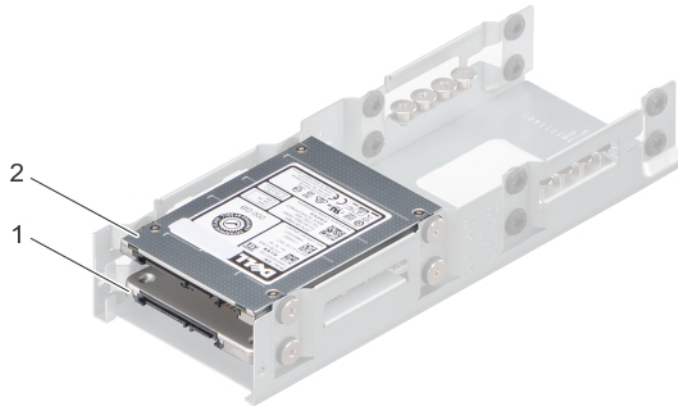
그림 2 . 2.5인치 SATA SSD

① 노트: SATA 드라이브 케이지(옵션)를 사용하여 비RAID로 구성된 2개의 SATA SSD. RAID 1을 수동으로만 구성하는 옵션.