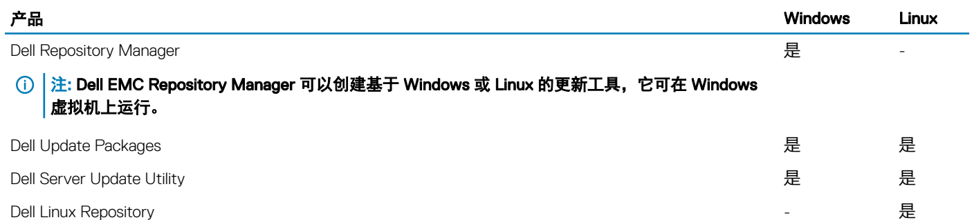
表. 1: Dell EMC 更新公用程序