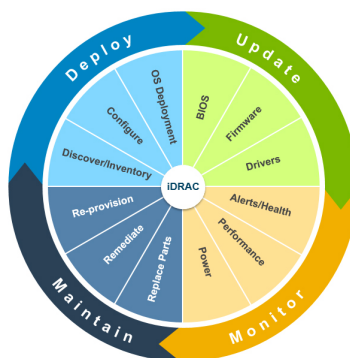
图 1: Dell 系统管理产品