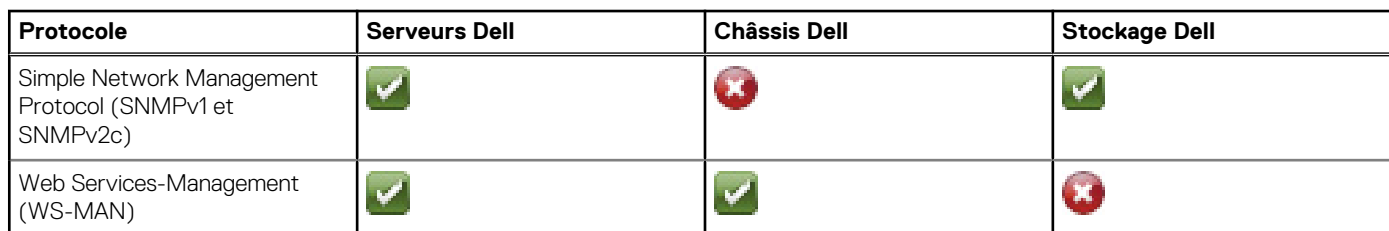
Tableau 1. Périphériques Dell et leurs protocoles pris en charge.

Pour détecter les périphériques iDRAC en utilisant le plug-in Dell OpenManage, vous pouvez opter pour le protocole SNMP ou WS-MAN en fonction de vos besoins. Cependant, pour détecter les périphériques de stockage Dell, vous devez utiliser le protocole SNMP, et pour détecter les châssis Dell, vous devez utiliser le protocole WS-MAN.