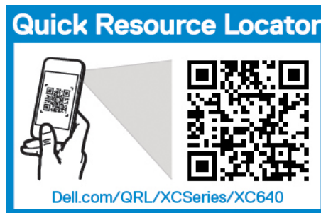
Figura 6. Localizador de recursos rápido

Utilice el Localizador de recursos rápido (QRL) para obtener acceso inmediato a la información del servidor y a los videos instructivos. Esto se puede hacer visitando Dell.com/QRL o utilizando el teléfono inteligente o una tableta y el código de Recurso rápido (QR) específico del modelo que se encuentra en el servidor Dell. Para probar el código QR, escanee la siguiente imagen.