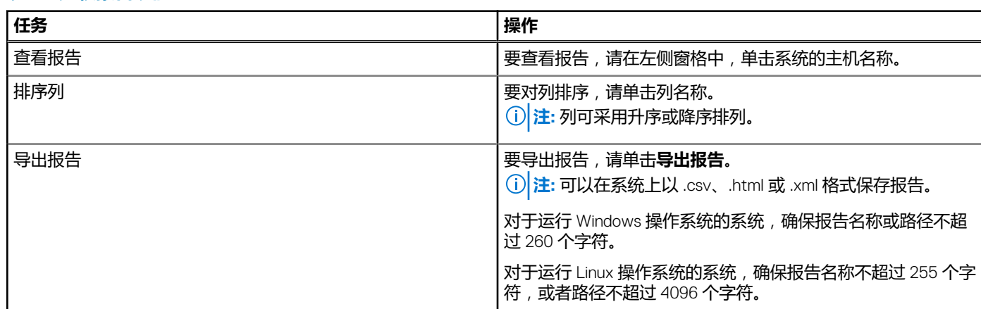
表. 3: 比较报告功能