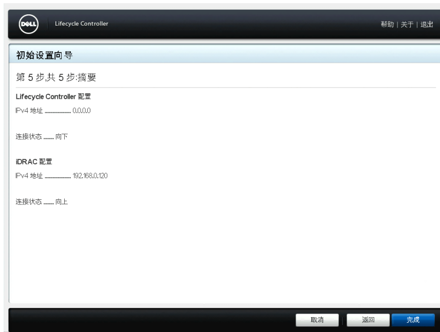
图 7: 摘要页面

注: 仅在首次启动 Lifecycle Controller 时才会显示 初始设置向导 。如果您想稍后进行配置更改，则重新启动服务器，按 F10 以启动 Lifecycle Controller，然后从 Lifecycle Controller 主页中选择 设置 或 系统设置 。