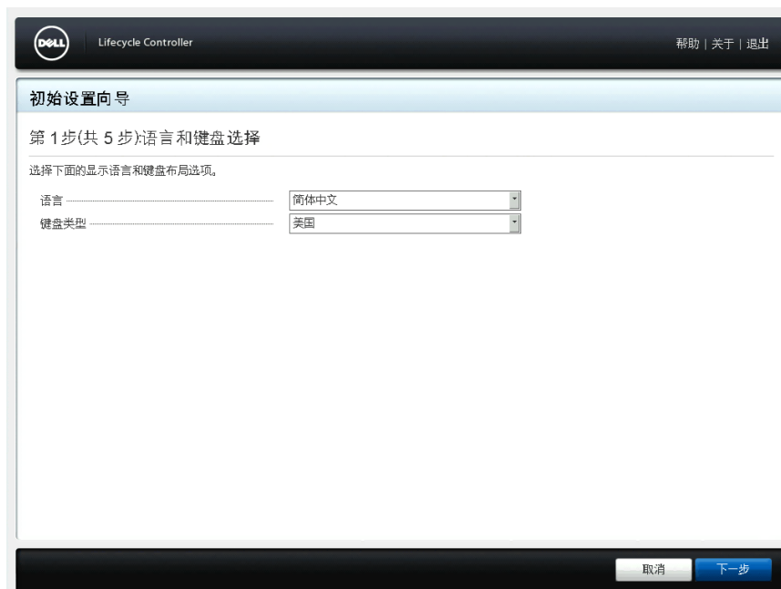
图 3: 语言和键盘选择页面