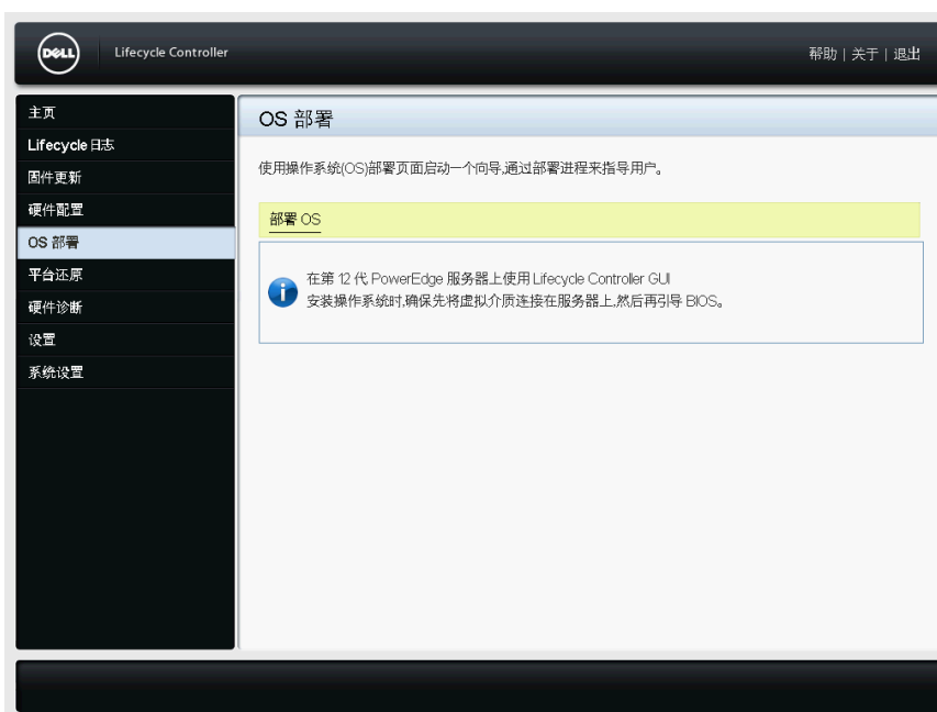
图 9: 操作系统部署页面

注: 如要观看“带 Lifecycle Controller 的 iDRAC”视频, 请访问 Delltechcenter.com/idrac 。