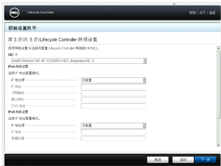
图 5: Lifecycle Controller 网络设置页面