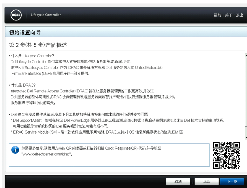
图 4: 产品概览页面