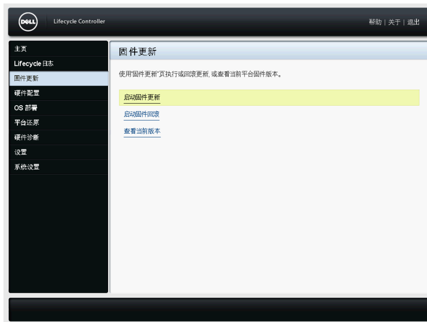
图 8: 固件更新页面