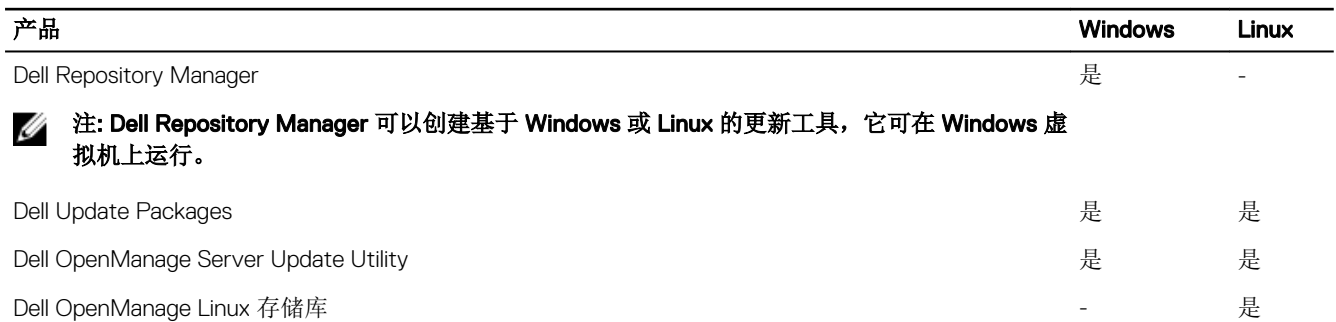
表. 1: Dell 更新公用程序