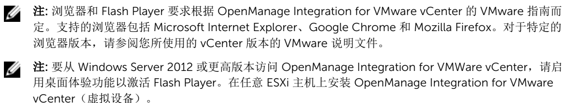
表. 1: vCenter Server 各版本的 Flash Player 要求

要显示 OpenManage Integration for VMware vCenter，系统必须至少具有 1024 x 768 的屏幕分辨率，并且具有满足与其操作系统对应的最低要求的 Web 浏览器。